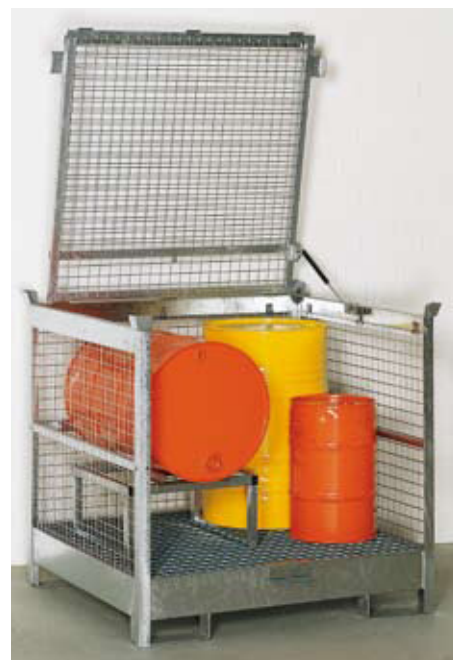
Die verschließbare Lagerbox SLB 4 mit Fassbock FB 1 und Fassauflage Standard. So können 200-l-Fässer auch liegend gelagert werden. Einzeln aufgestellt für wassergefährdende und brennbare Flüssigkeiten geeignet.