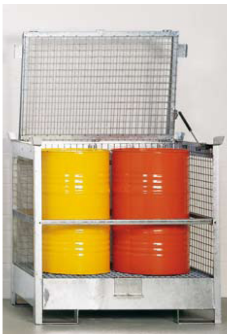
Die verschließbare Lagerbox SLB 2 bietet Platz für die stehende Lagerung von 2x200-l-Fässern. Einzeln aufgestellt für wassergefährdende und brennbare Flüssigkeiten geeignet.