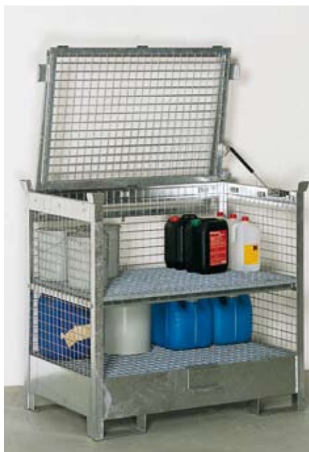
Verschließbare Lagerbox SLB 2 mit zusätzlicher Gitterrostebene für optimale Raumaussnutzung bei der Lagerung von Klein- gebinden. Einzeln aufgestellt für wassergefährdende und brennbare Flüssigkeiten geeignet.