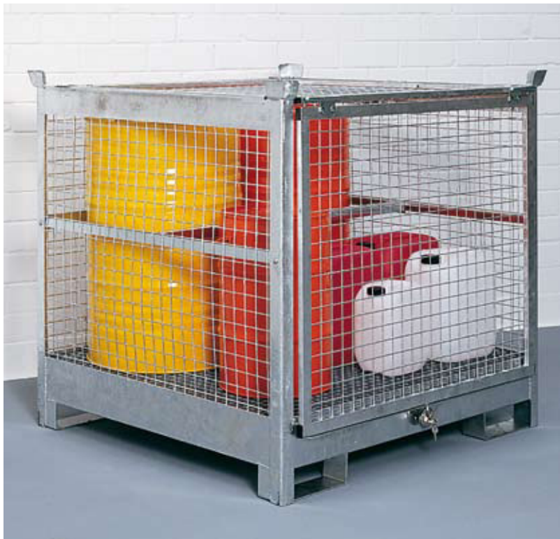
Die verschließbare Lagerbox SLB 4 bietet Platz für die stehende Lagerung von 4 Fässern à 200 l. Der verstellbare Sicherungsriegel sichert die Fässer während des Transportes. Die Lagerbox kann mit einem Diskusschloss gegen Diebstahl und unbefugten Zugriff gesichert werden. Einzeln aufgestellt für wassergefährdende und brennbare Flüssigkeiten geeignet.