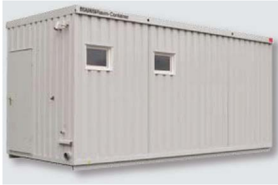
Sanitärmodul 6 m mit Kippfenster