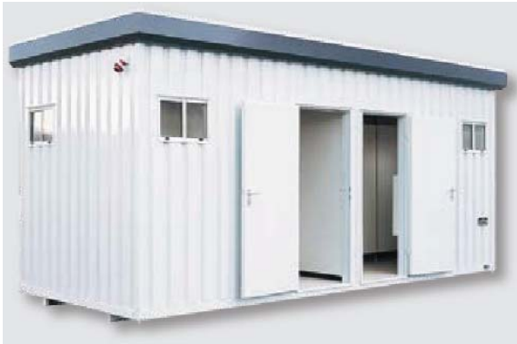
Beispiel Toilettenmodul 6853 6 m