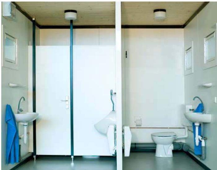
Innenansicht Toilettenmodul Damen und Herren. (Zur Besseren Darstellung ohne rechte WC-Trennwand)