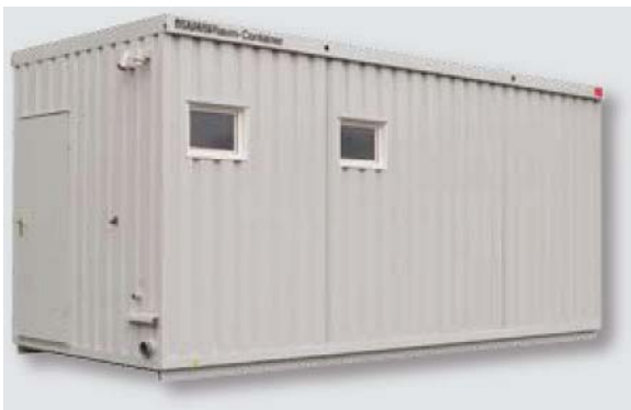
Beispiel 4857 mit Kippfenster und 2 CEE- Anbaugerätesteckern