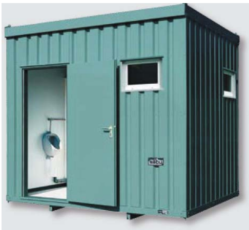
Beispiel 3852 (ohne Schamwand)