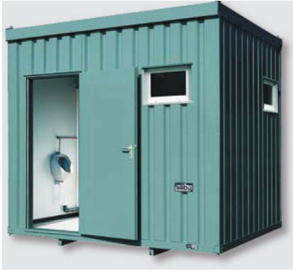
Beispiel 3852 (ohne Schamwand)