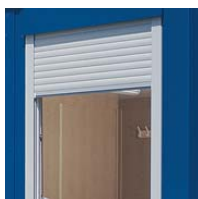
PVC Fenster mit Doppelverglasung und integriertem Rollladen