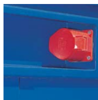
Versenkter CEE-Anschluss im Dachrahmen